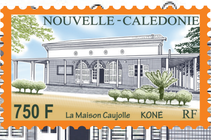
La maison Caujolle Lettre philatélique 2014-06